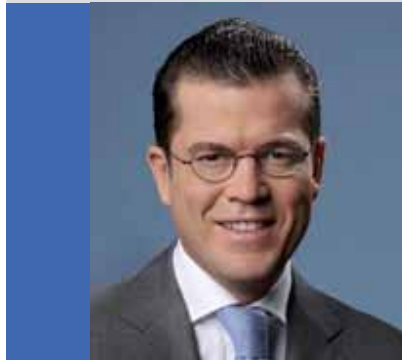
Dr. Karl-Theodor Freiherr zu Guttenberg

Bundesminister für Wirtschaft und Technologie. Das komplette Interview finden Sie auf www.existenzgruender.de