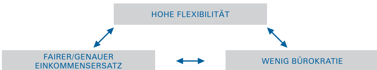
ABBILDUNG 2: ZIELDREIECK ZUR BEWERTUNG VON LÖSUNGSVORSCHLÄGEN