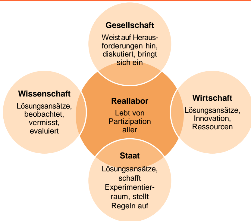
Abbildung 1: Am Reallabor beteiligte Parteien

ethisch begründete und gemeinwohlorientierte Forschungs-, Praxis- und Bildungsziele zu verfolgen (vgl. Beecroft et al. 2018). Somit lebt ein Reallabor von der Partizipation und der aktiven Beteiligung von Vertretern unterschiedlicher Anspruchsgruppen (Abbildung 1).